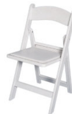
4. Chaise en résine blanche