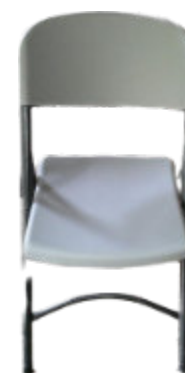
3. Chaise en plastique