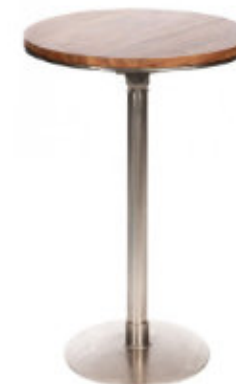
2. Table bistro