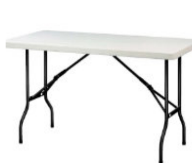
1. Table rectangulaire (6 pieds)