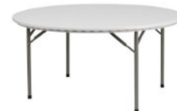
6. Table ronde